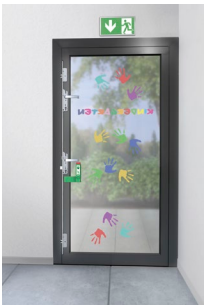
Abbildung 5: Abb.5_FUHR_Kindergarten-Loesung_xxx.jpg

Sofern nicht gesondert gekennzeichnet, liegen alle Bildrechte bei CARL FUHR GmbH & Co. KG, Heiligenhaus