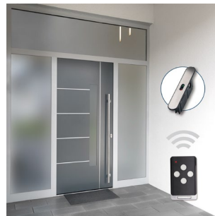
Abbildung 4: Abb.4_FUHR_Tagesfalle per Funk_xxx.jpg