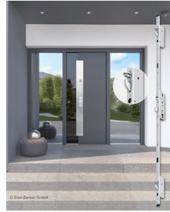
Abbildung 2: Abb.2_FUHR_DuoSecure-Verriegelung_xxx.jpg