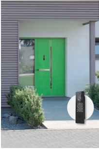
Abbildung 1: Abb.1_FUHR_SmartConnect door_xxx.jpg